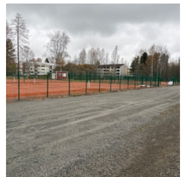
Seinäjoen urheilupuiston tenniskenttä