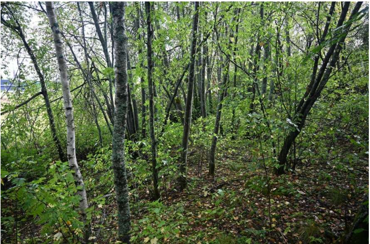
Kuva 2. Alueen puusto on pääsääntöisesti nuorehkoa ja lehtipuuvaltaista.