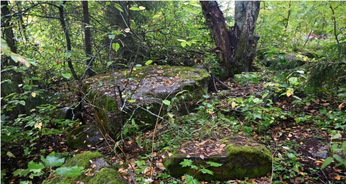
Kuva 7. Vanhoja kivrakenteita Kokkilanpuistossa