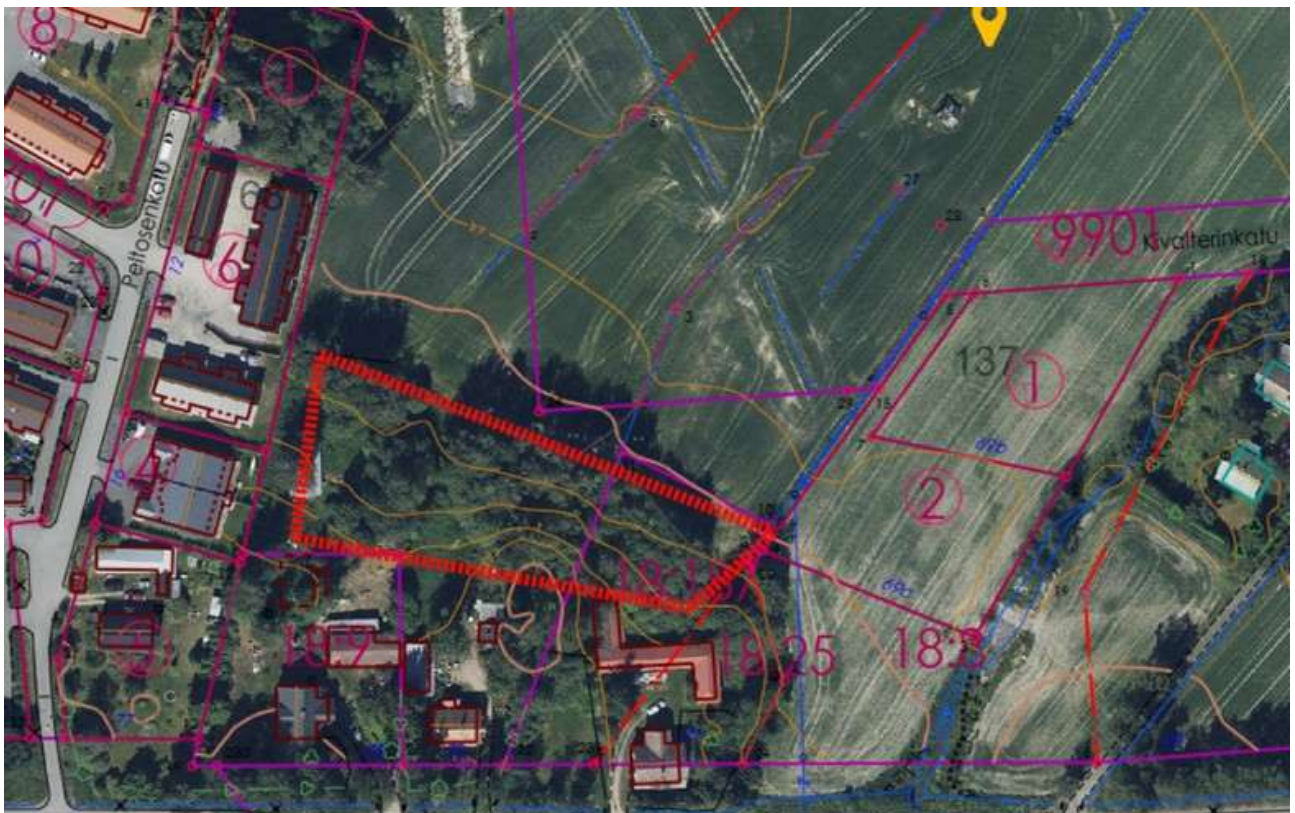
Ilmakuva 1. Kohteen aluerajaus; pinta-ala n. 4000 neliometriä.