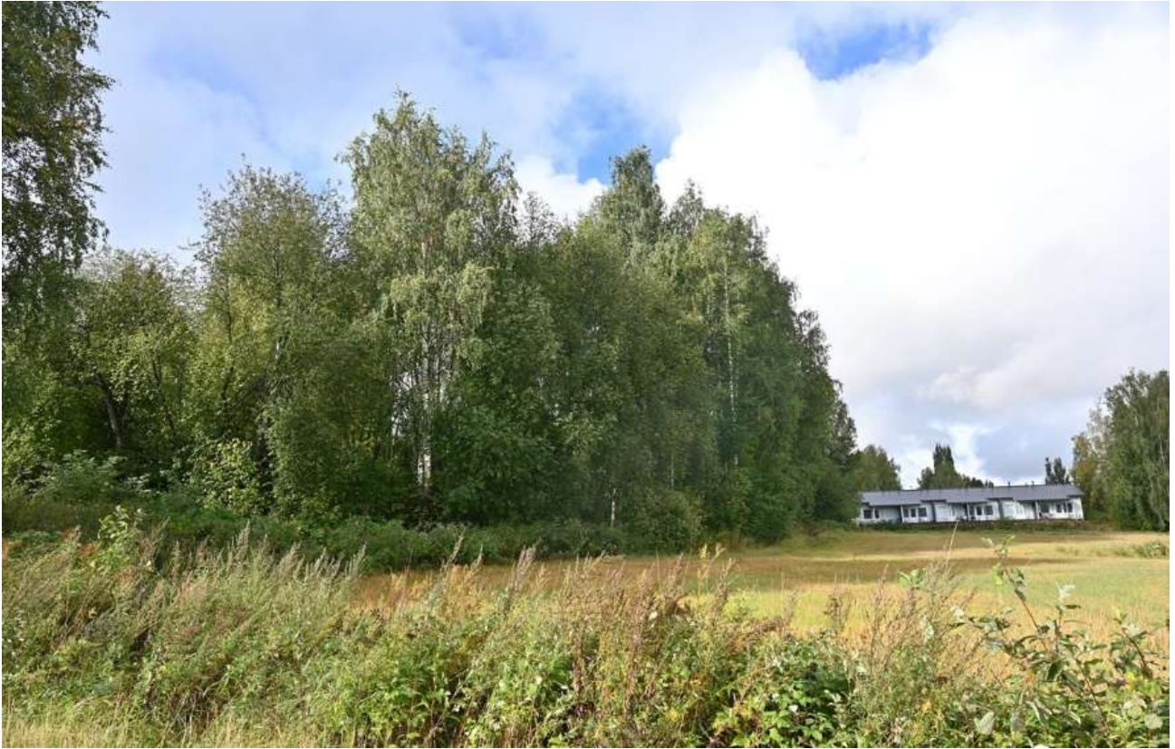
Kuva 1. Kokkilanpuiston lehtipuuvaltainen pellonreunusmetsä on lehtipuuvaltainen; hieskoivu, rauduskoivu, tuomi, pihlaja, vaahtera, raita. Kuvaussuunta W. Taustalla Peltosenkadulla oleva rivitalo.