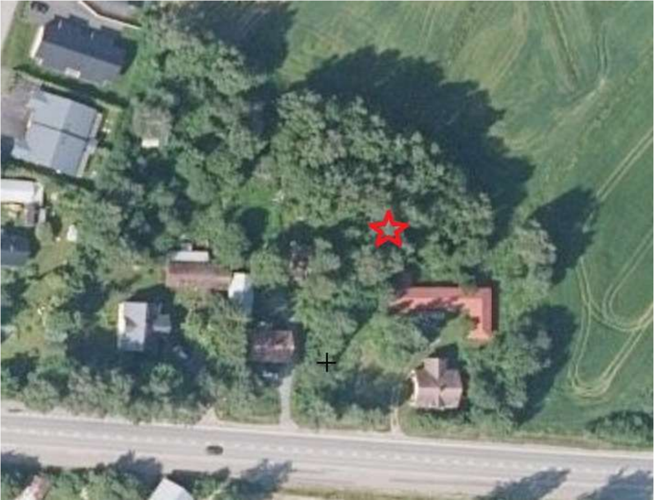
Ilmakuva 3. Kivirakenteiden viitteellinen sijainti.