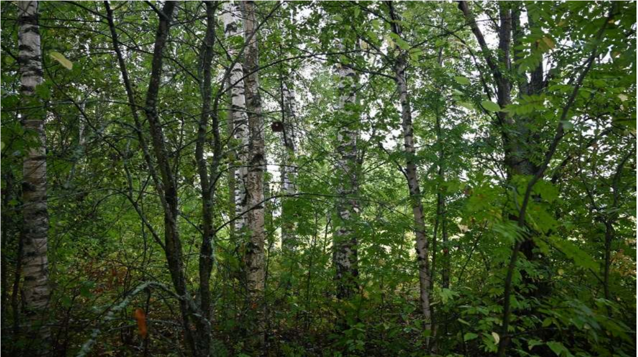
Kuva 3. Kohteen merkittävin luontoarvo on pellonreunan suurehkot n. 60–70 vuotta vanhat koivut ja haavat.