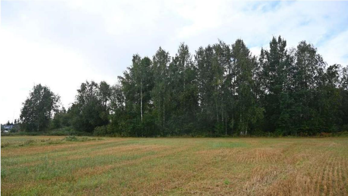
Kuva 9. Kokkilanpuiston itäosa. Kuvaussuunta S.