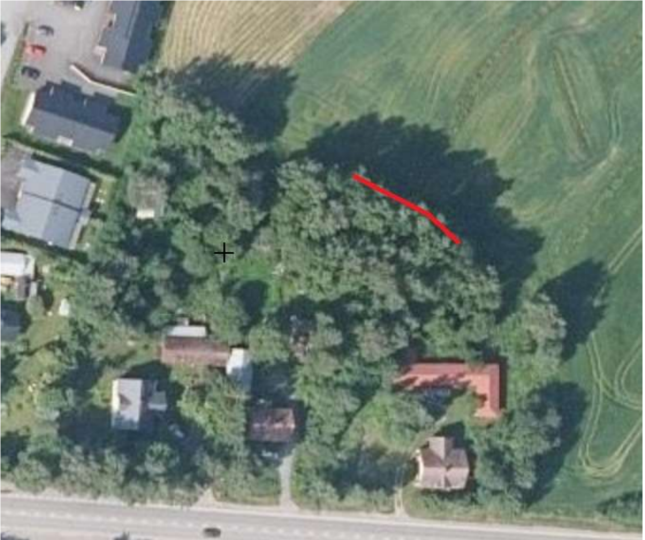
Ilmakuva 2. Kuvien 3 ja 4 pellonreunuspuiden sijainti.