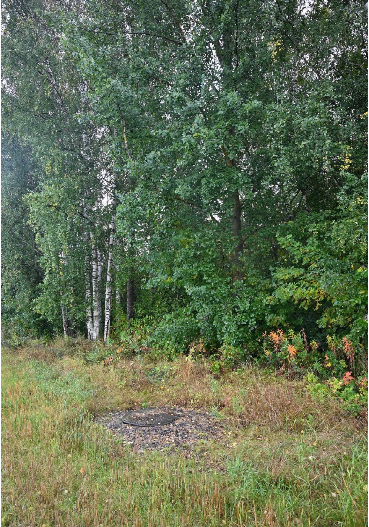
Kuva 5. Pellonreunuspuut ja kaivo