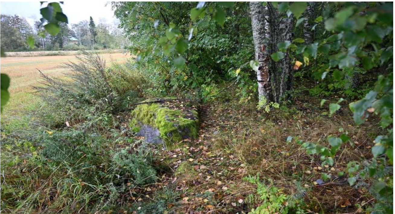
Kuva 8. Pellonreunan laakea lohkare