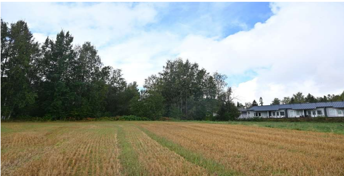
Kuva 10. Kokkilanpuiston länsiosa. Kuvaussuunta S.