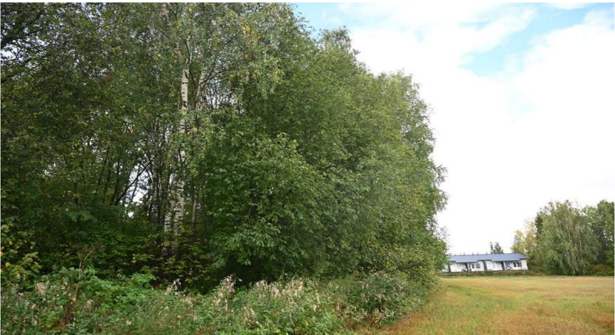
Kuva 4. Pellonreunuspuustoa