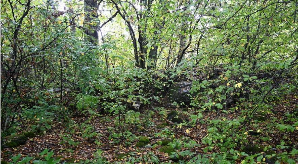
Kuva 6. Vanhoja kivrakenteita Kokkilanpuistossa