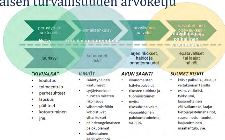
Kuva 1 Sisäisen turvallisuuden arvoketju

Turvallisuussuunnitelman laadinnassa on huomioitu paikallisen ja alueellisen turvallisuussuunnittelun kansalliset linjaukset (Sisäministeriö, 2019). Linjausten painopistealueet ovat nuorten rikollisuuden vähentäminen, ikäntyneiden asumisen turvallisuuden kehittäminen, lähisuhdeväkivallan vähentäminen, hyvien väestösuhteiden edistäminen, alkoholista johtuvien turvallisuushaittojen ennaltaehkäisy ja julkisten tilojen turvallisuus. Painopisteitä sovellettaessa on kuitenkin huomioitu Seinäjoen kaupungin erityispiirteet ja eri tahojen kuulemisissa esiinnousseet teemat ja toiveet. Turvallisuussuunnitelmassa on pyritty mahdollisimman kattavasti huomioimaan myös kaupungin eri alueiden erityispiirteitä.