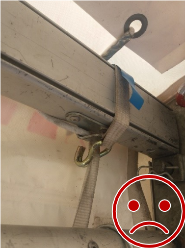
Kuormaliina leikkaantuu kiristyessään.