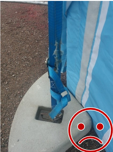
Kuormaliina on kulunut.