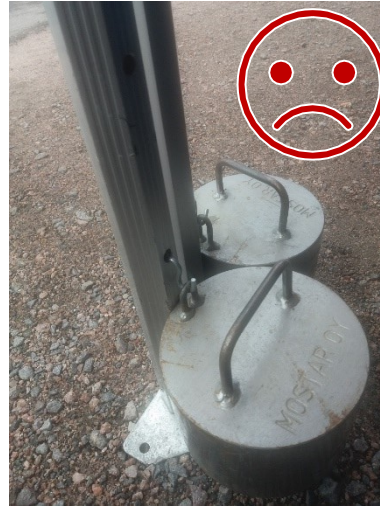
Painojen teräskoukku ei ole lukittu. Teräs leikkaa alumiinia, jolloin kiinnitys ei ole toimiva.