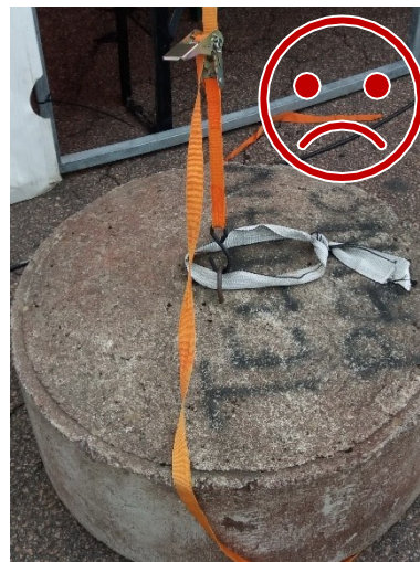
S-koukku irtoaa rakenteen joustassa tuulella. Kiinnitystä ei ole lukittu kiinnityspisteeseen.