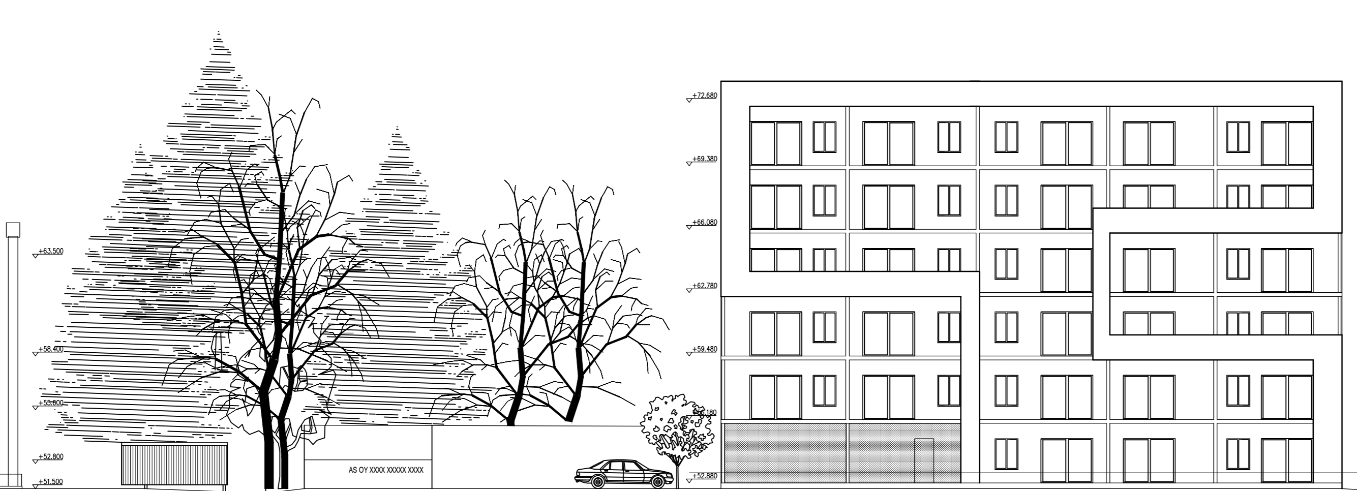
AS OY XXXXXX XXXXXX ISÄNNÄNTIE 6