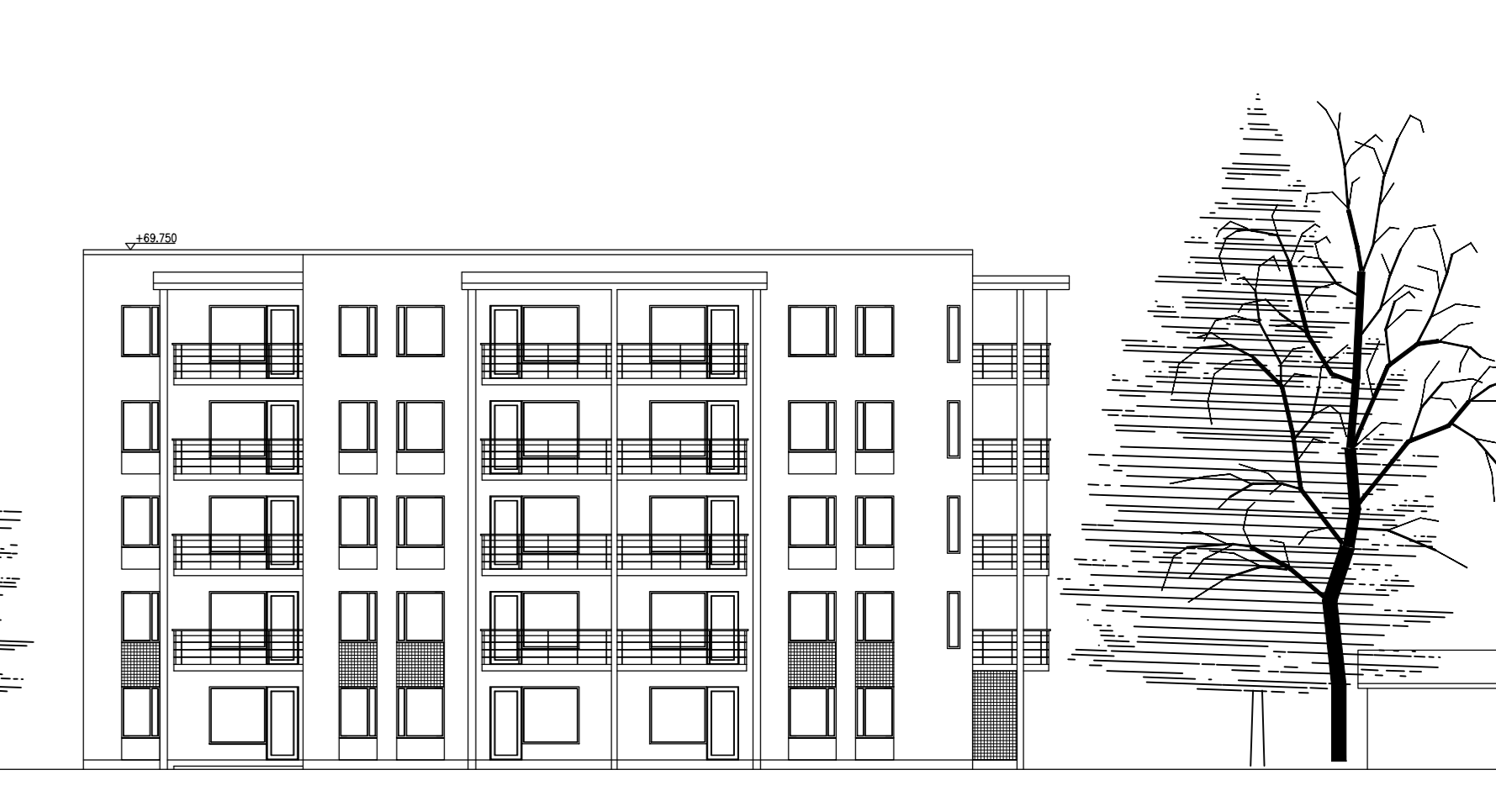
AS OY SEINÄJOEN EMÄNNÄNKARTANO, EMÄNNÄNTIE 5