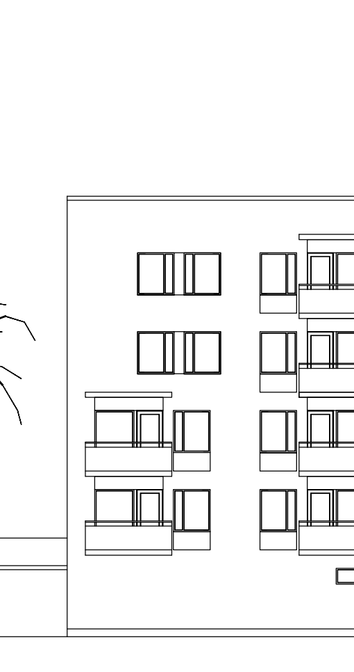
AS OY SEINÄJOEN ISÄNNÄNTIE 27