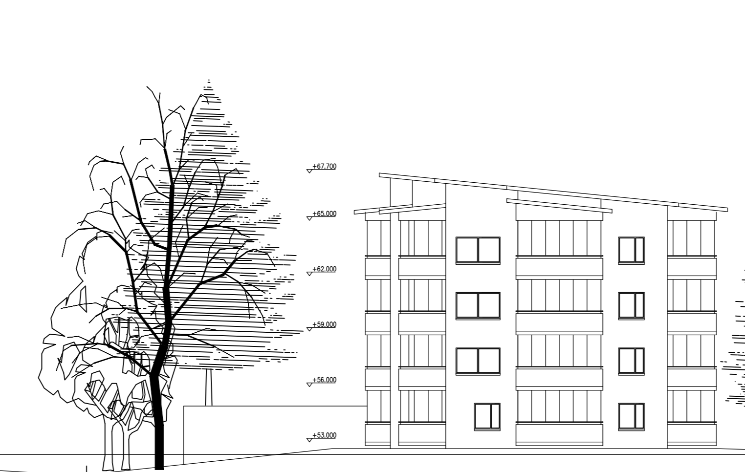
AS OY SEINÄJOEN HELENA ISÄNNÄNTIE 8