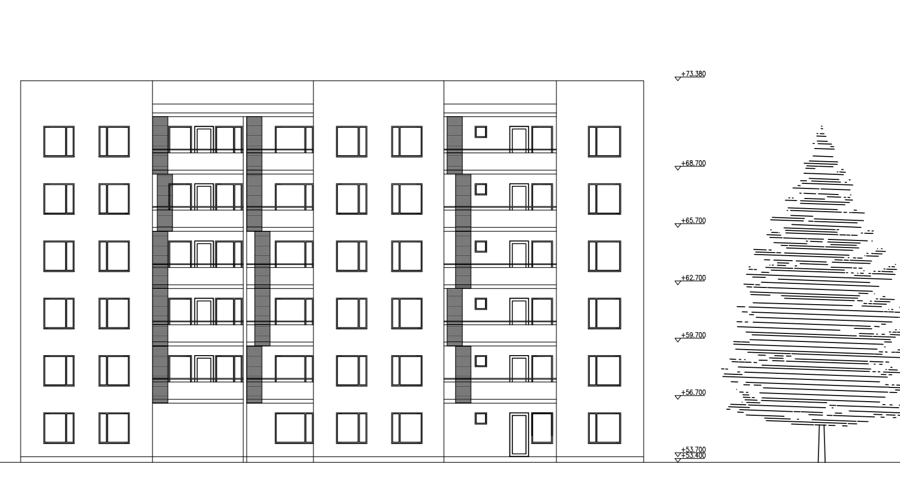
AS OY SEINÄJOEN ISÄNTÄ, ISÄNNÄNTIE 37