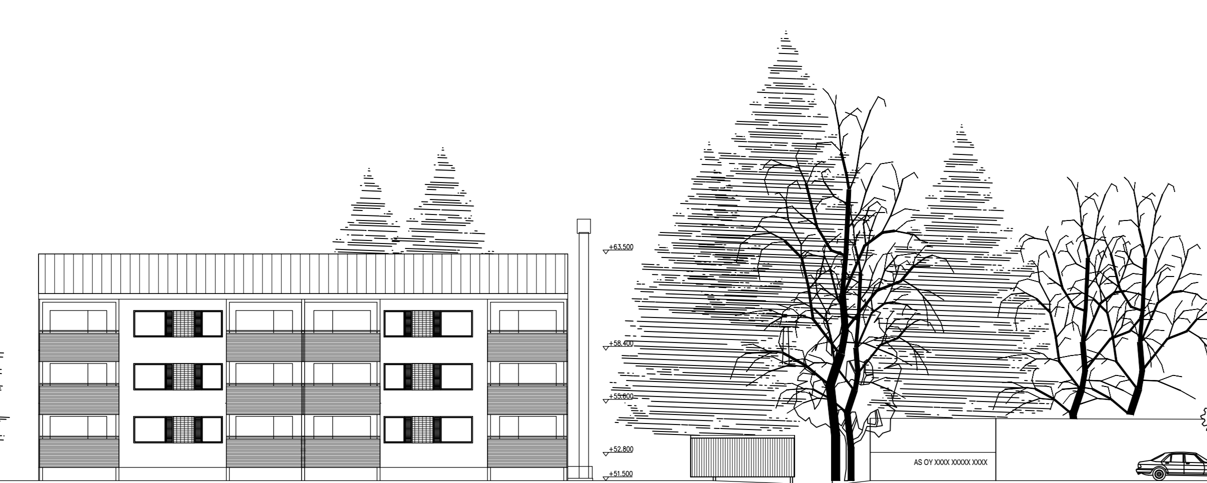
AS OY HALLILANHOVI ISÄNNÄNTIE 4