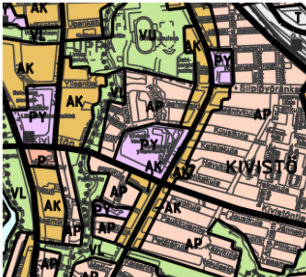
Ote Seinäjoen yleiskaavasta 1994

Alue on osayleiskaavassa Julkisen palvelujen ja hallinnon aluetta (PY).