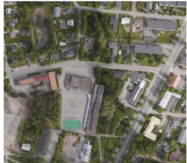
Ilmakuva alueesta vuodelta 2018

Suunnittelualueella sijaitsee vuonna 1954 rakennettu paritalo. Suunnittelualue sijaitsee Seinäjoen yhteiskoulun ja Kivipuron kuntoutuskodin välisellä asemakaavan mukaisella puistoalueella. Alue soveltuu edelleen asumiseen, joten on perusteltua tehdä alueelle asemakaavan muutos ja palauttaa alue pientaloasumiseen.